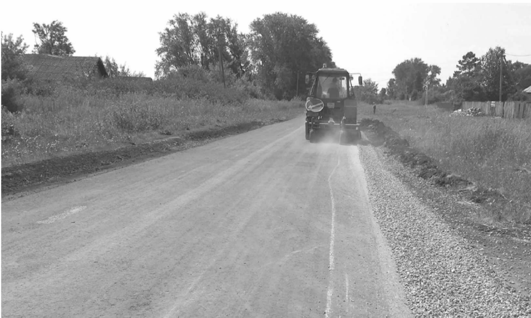
Хорошие дороги... Они необходимы селу