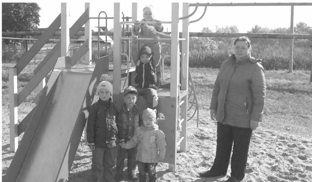
Детская площадка: с удовольствием здесь отдыхают и играют дети