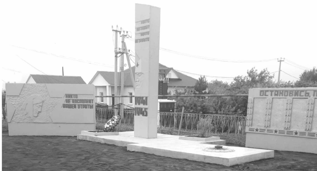
В селе Чистовка восстановлен памятник воинам Великой Отечественной войны